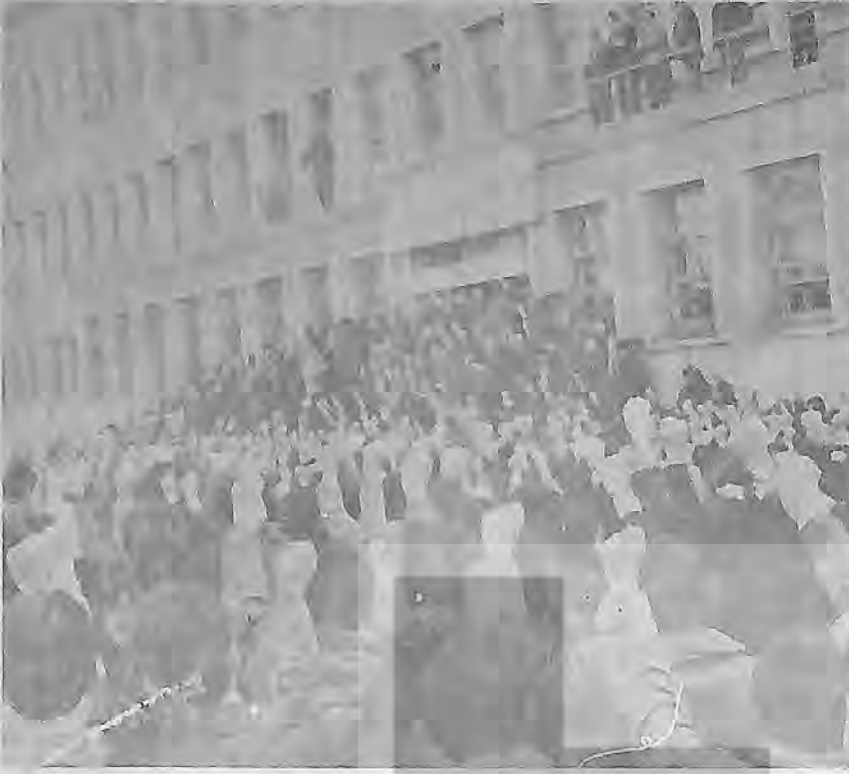
cettepe Ün. de bir kez işgal girişimine maruz kaldı.

1976 yılının sonlarına gelirken "gazetelere geçen yaralama ve ölümler biten önemli saldırıların toplam sayısı 347'dir.