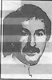
Basına yönelik bu baskılara karşı neler yapılmalıdır?

üzerine mali ve maddi bir baskı oluşturuyor. Siyasal baskılara gelince; yasalardaki yasakların yanısıra, siyasal iktidar çeşitli bürokratik eylemlerle yayın hayatında ağırlığını duyurmaktadır. Çeşitli kitapların toplatılması, üstüste davaların açılması, yazarların ve yayıncıların gözaltına alınmaları adli olmaktan çok siyasal bir nitelik taşımaktadır. Özetle; basın-yayın hayatı anti-demokratik ve ağır baskılar altındadır.